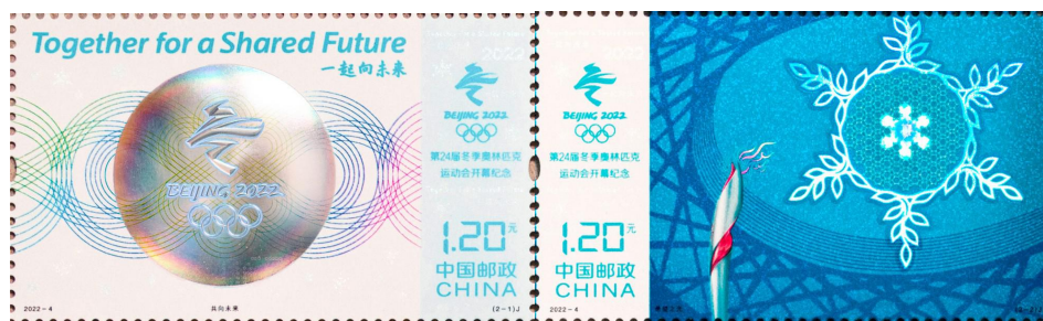
图 4.3 《第 24 届冬季奥林匹克运动会开幕纪念》纪念邮票荣获最佳设计奖