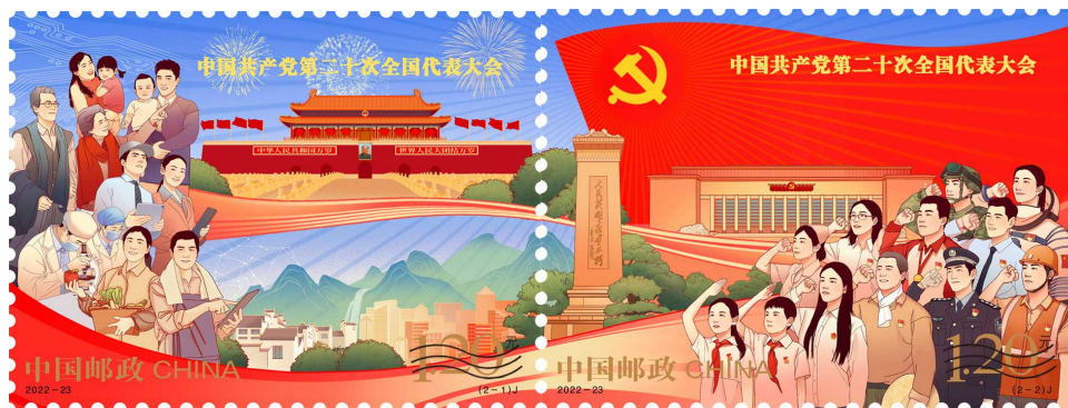
图 4.2 《中国共产党第二十次全国代表大会》纪念邮票荣获最佳邮票奖