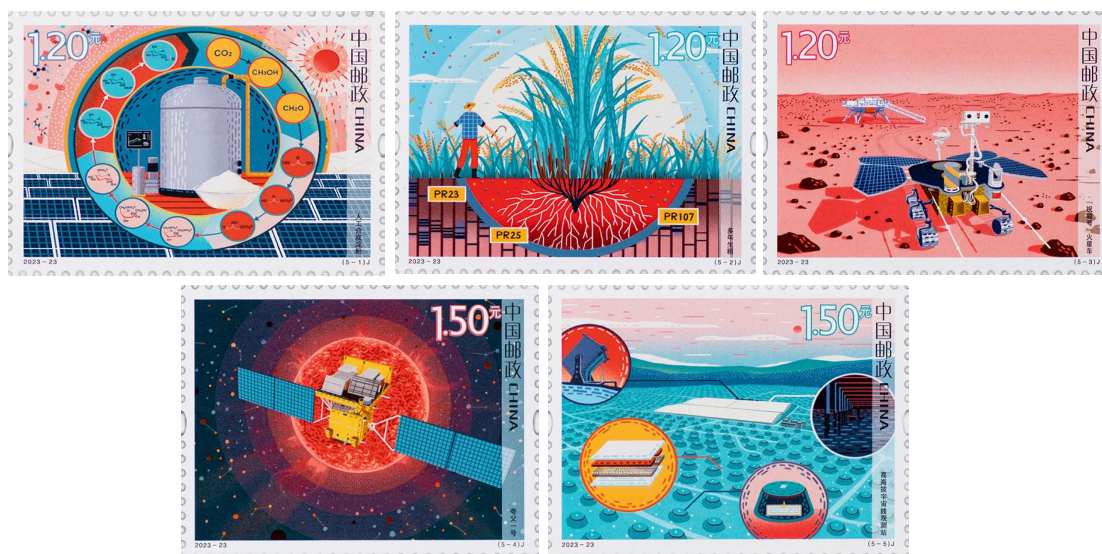
图 1.4 《科技创新（四）》纪念邮票