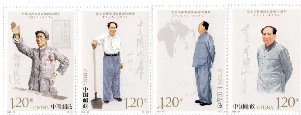
图 1.3 《纪念毛泽东同志诞辰 130 周年》纪念邮票

家邮政局推荐了纪念邮票选题。经评审研究，列入 2023 年发行计划纪念邮票选题共 12 套，主要包括《纪念毛泽东同志诞辰 130 周年》《中华人民共和国第十四届全国人民代表大会》《毛泽东“向雷锋同志学习” 题词发表六十周年》《“一带一路” 倡议提出十周年》《科技创新（四）》《成都第 31 届世界大学生夏季运动会》《杭州第 19 届亚洲运动会》等选题，涉及政治、经济、文化、体育、外交等多个领域。