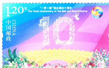
图 2.4 《“一带一路”倡议提出十周年》纪念邮票

《中华人民共和国第十四届全国人民代表大会》《世界上第一株杂交水稻培育成功五十周年》等多套纪念邮票中使用调频+调幅混合加网、缩微文字等防伪技术，提高邮票防伪性能，增加防伪壁垒。