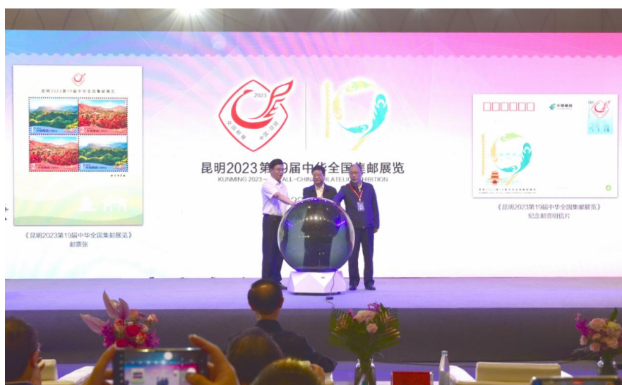
图 4.1 2023 第 19 届中华全国集邮展览

4 月 27 日至 5 月 1 日在云南省昆明市成功举办 2023 第 19 届中华全国集邮展览。以集邮文化为载体，举旗帜、聚民心、育新人、兴文化、展形象，彰显了新时代集邮文化事业，为推进文化自信自强、建设社会主义文化强国、丰富人民群众多样化文化需求发挥独特作用。