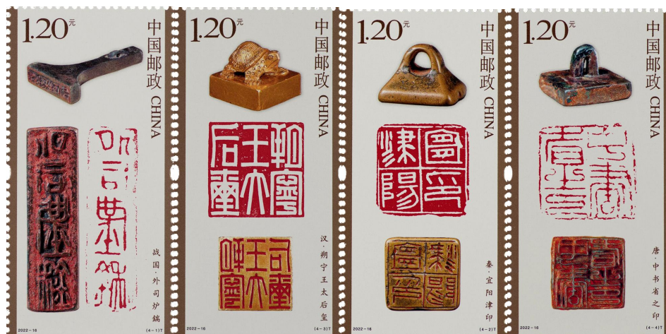
图 4.4 《中国篆刻》特种邮票荣获最佳印刷奖