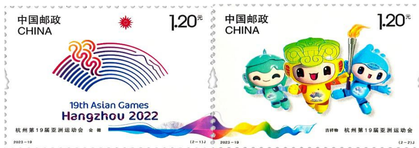
图 2.2 《杭州第19届亚洲运动会》纪念邮票

安全防伪纸张，安全线很好地融入画面设计，变身水陆分界线，同时应用烫印工艺展现流动的光影和色彩；邮票采用杭州西湖地标“三潭映月”形状异型齿孔，在紫光灯下观察，邮票内数个橘色杭州地标跃然纸上。北京邮票厂有限公司采用近年新研发的影胶套印技术印制《杭州第19届亚洲运动会》纪念邮票版式一，有效解决了影写版和胶版单一印刷方法的不足。