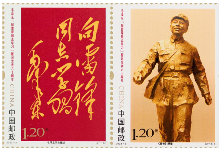
图 1.1 《毛泽东“向雷锋同志学习”题词发表六十周年》纪念邮票

1. 邮票发行套数。2023 年，发行纪特邮票 27 套 86 枚（纪念邮票 12 套，特种邮票 15 套，含小型张 3 枚，小全张 1 枚 1 ），另发行《癸卯年》特种邮票小本票 1 本。（见附件一）