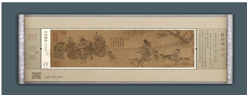
图 1.2 《货郎图》特种邮票小型张

2. 邮票发行数量。一是纪特邮票发行数量 2 。2023 年，中国邮政集团有限公司向国家邮政局报备并向社会公告了 2022 年发行的 27 套纪特邮票的实际发行数量，纪特邮票（含小型张、