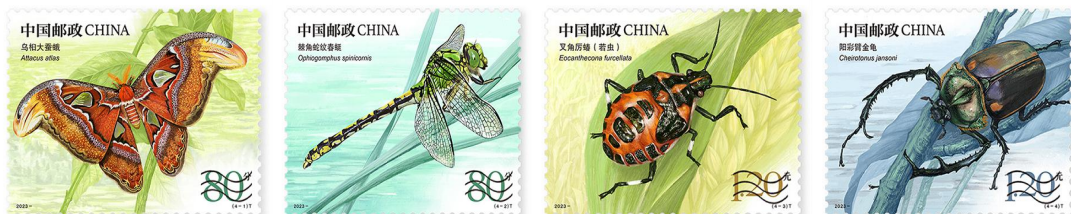
图 2.3 《昆虫（二）》特种邮票

《昆虫（二）》特种邮票应用三维起凸结合采用五色胶印并附加局部压凸和烫印工艺，增强了邮票的立体效果，赋予了昆虫“向上”的动感，使昆虫在纸上栩栩如生，充满生命的活力。