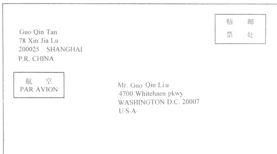
图 2 国际信函封面书写示范